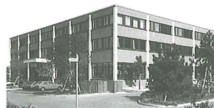
Das Zuger Gründerzentrum

Bereits haben sich 18 Neuunternehmen im Zuger Gründerzentrum eingemietet. Das Spektrum reicht von EDV-Dienstleistungen, Treuhand, Teilzeitmanagement, über Graphik + Satz bis zu Dienstleistungen im Bereich Umwelt/Recycling, Bauimmissionsüberwachung sowie der Entwicklung von pharmazeutischen Verpackungsmaschinen oder Messmikroskopen.