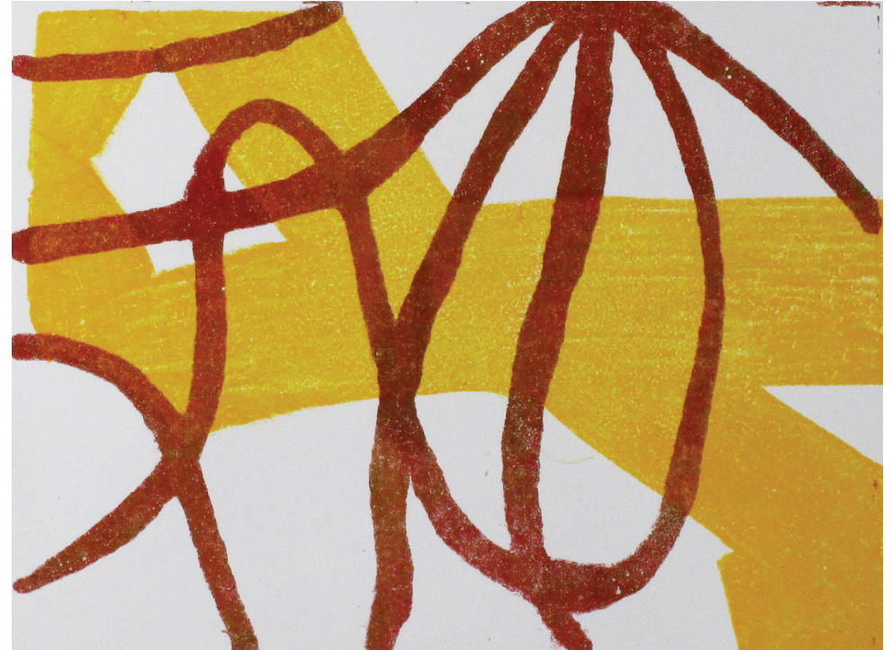
Bilder: Arbeiten aus dem Angewandten und Bildnerischen Gestalten

Das Sekretariatsteam unterstützt im administrativen Bereich den Schulbetrieb und ist Anlaufstelle für allgemeine Auskünfte und Anfragen. Das Sekretariat befindet sich im Parterre des Trakts 3 (OG).